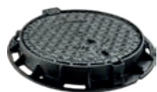
MAXUM E600 et F900