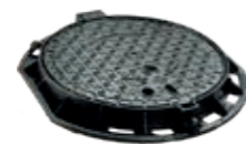
MAXUM Ht 75

Favorise l'aération dans les regards ou permet une utilisation en collecte des eaux sous circulation intense.