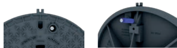
Systeme 1/4 de tour

Verrouillage ou déverrouillage par simple rotation d'1/4 de tour de la vis tête H (vis codée sur demande).