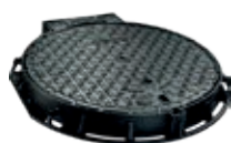
MAXUM OL 800

Idéal pour les réfections de voirie avec un encombrement réduit. Hauteur totale de 75 mm.